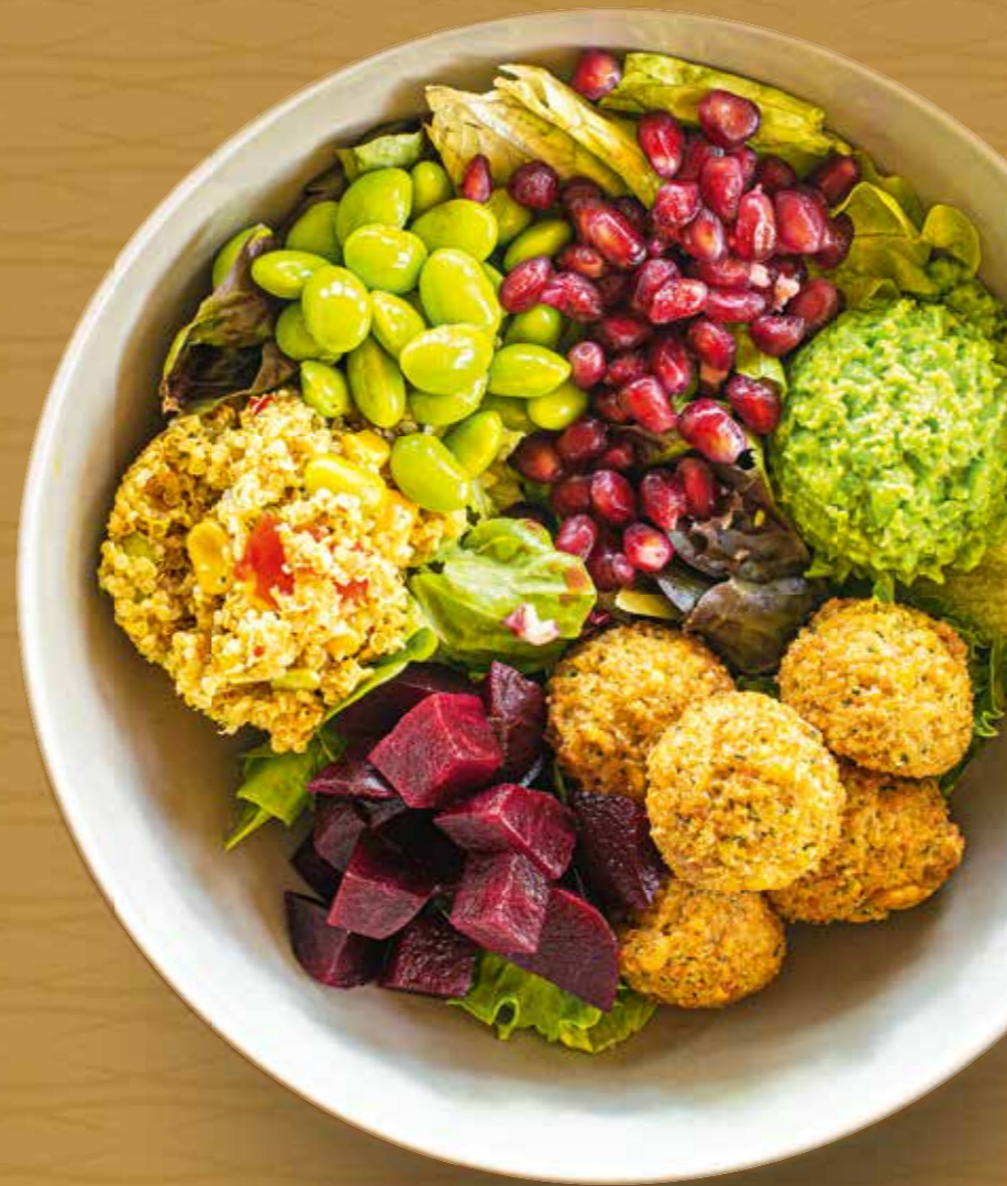
BUNTE SALAT BOWL

DIENSTAG IST BURGER-TAG! Zu jedem Burger gibt es ein TONI's Bier 0,33l gratis dazu!